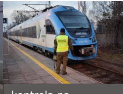
kontrola na dworcach kolejowych