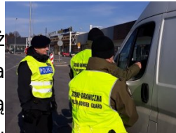
kontrola na szlakach komunikacyjnych

Kilkanaście lat temu Straż Graniczna kojarzona była głównie z fizyczną ochroną granicy i kontrolą ruchu granicznego. Jednak na skutek zmian jakie nastąpiły po przyłączeniu Polski najpierw do Unii Europejskiej, a potem do Układu z Schengen, z formacji typowo granicznej, Straż Graniczna została przekształcona w nowoczesną, dobrze wyposażoną służbę graniczno-migracyjną działającą na obszarze całego kraju.