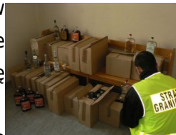
alkohol bez polskich znaków akcyzy skarbowej