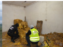
nielegalna krajanka tytoniowa