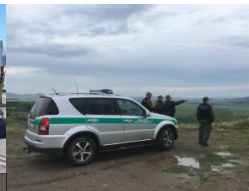
udział w misjach zagranicznych