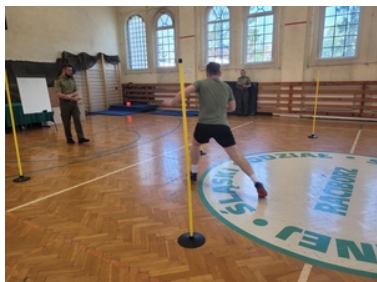
Kandydat do służby ćwiczy na sali gimnastycznej