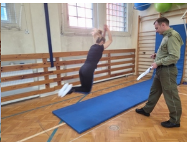
Kandydatka do służby ćwiczy na sali gimnastycznej