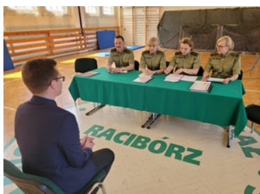
Rozmowa kwalifikacyjna z kandydatem do służby