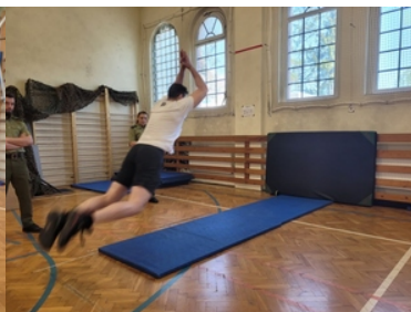
Kandydat do służby ćwiczy na sali gimnastycznej