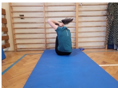
Kandydatka do służby ćwiczy na sali gimnastycznej