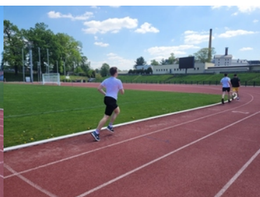
Kandydaci do służby biegają na stadionie