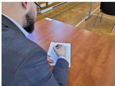
Kandydat do służby pisze test z języka obcego