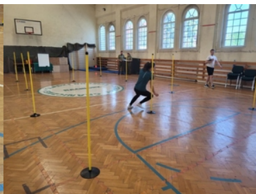
Kandydatka do służby ćwiczy na sali gimnastycznej