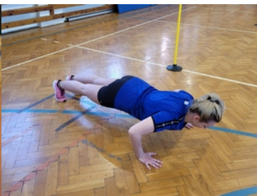
Kandydatka do służby ćwiczy na sali gimnastycznej