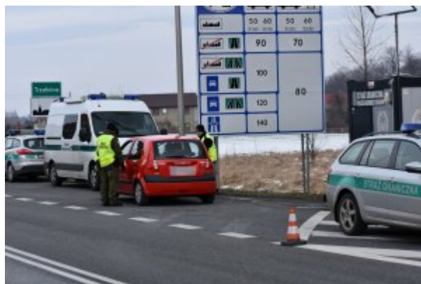
tymczasowe przywrócenie kontroli granicznej w Trzebini

W zasięgu terytorialnym Śląskiego Oddziału Straży Granicznej zostało wyznaczonych 99 miejsc (na terenie województwa śląskiego - 62, na terenie województwa opolskiego -