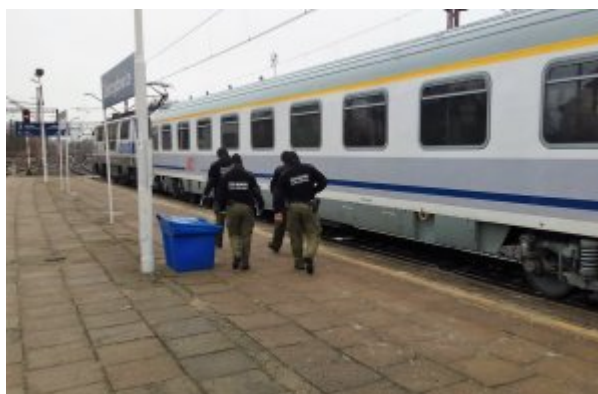
tymczasowe przywrócenie kontroli granicznej w Zebrzydowicach

Obywatele państw trzecich muszą spełnić warunki wjazdu określone w przepisach i posiadać paszport oraz wizę, jeśli jest wymagana. Lista państw,