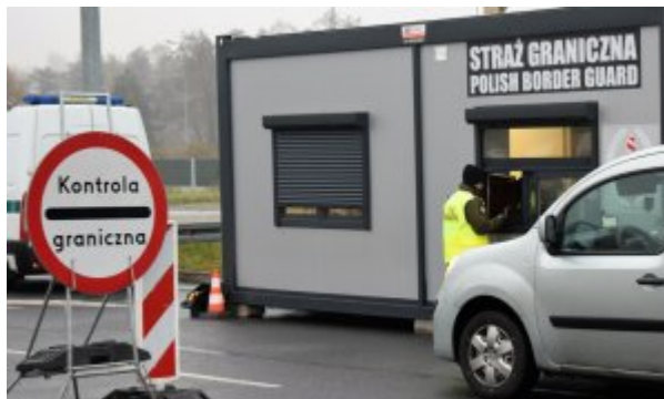
tymczasowe przywrócenie kontroli granicznej w Gorzyczkach

Wszyscy odwiedzający Polskę powinni być przygotowani na konieczność okazania dokumentów oraz udostępnienia do kontroli pojazdu, którym podróżują.