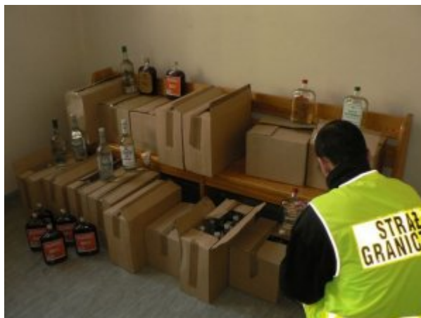
alkohol bez polskich znaków akcyzy skarbowej