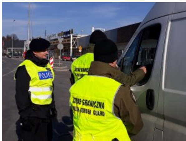
kontrola na szlakach komunikacyjnych

By móc egzekwować przepisy prawa oraz zapewnić bezpieczeństwo i porządek publiczny w warunkach braku kontroli granicznej oraz skutecznie rozpoznawać i przeciwdziałać zjawiskom przestępczym towarzyszącym otwarciu granic, konieczne było wprowadzenie zmian, które umożliwiałyby realizowanie tych zadań w głębi kraju. Dlatego też w działaniu granicy