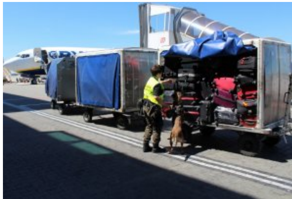
kontrola bagaży na lotnisku

Dotychczasowy - tradycyjny model związany z fizyczną ochroną granicy państwowej i kontrolą ruchu granicznego, zastąpiły czynne działania kontrolne poza obszarem granicznym, wsparte