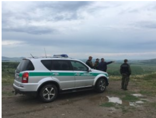
udział w misjach zagranicznych