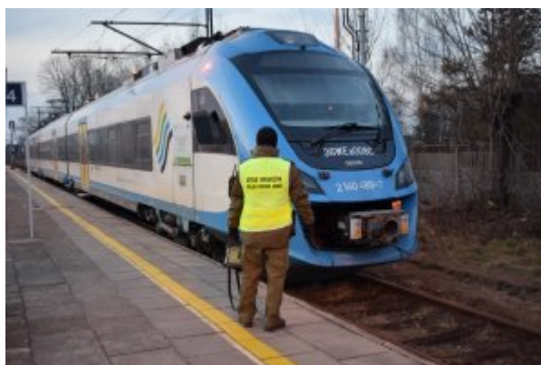
kontrola na dworcach kolejowych