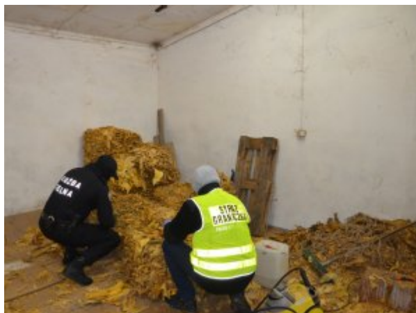
nielegalna krajanka tytoniowa